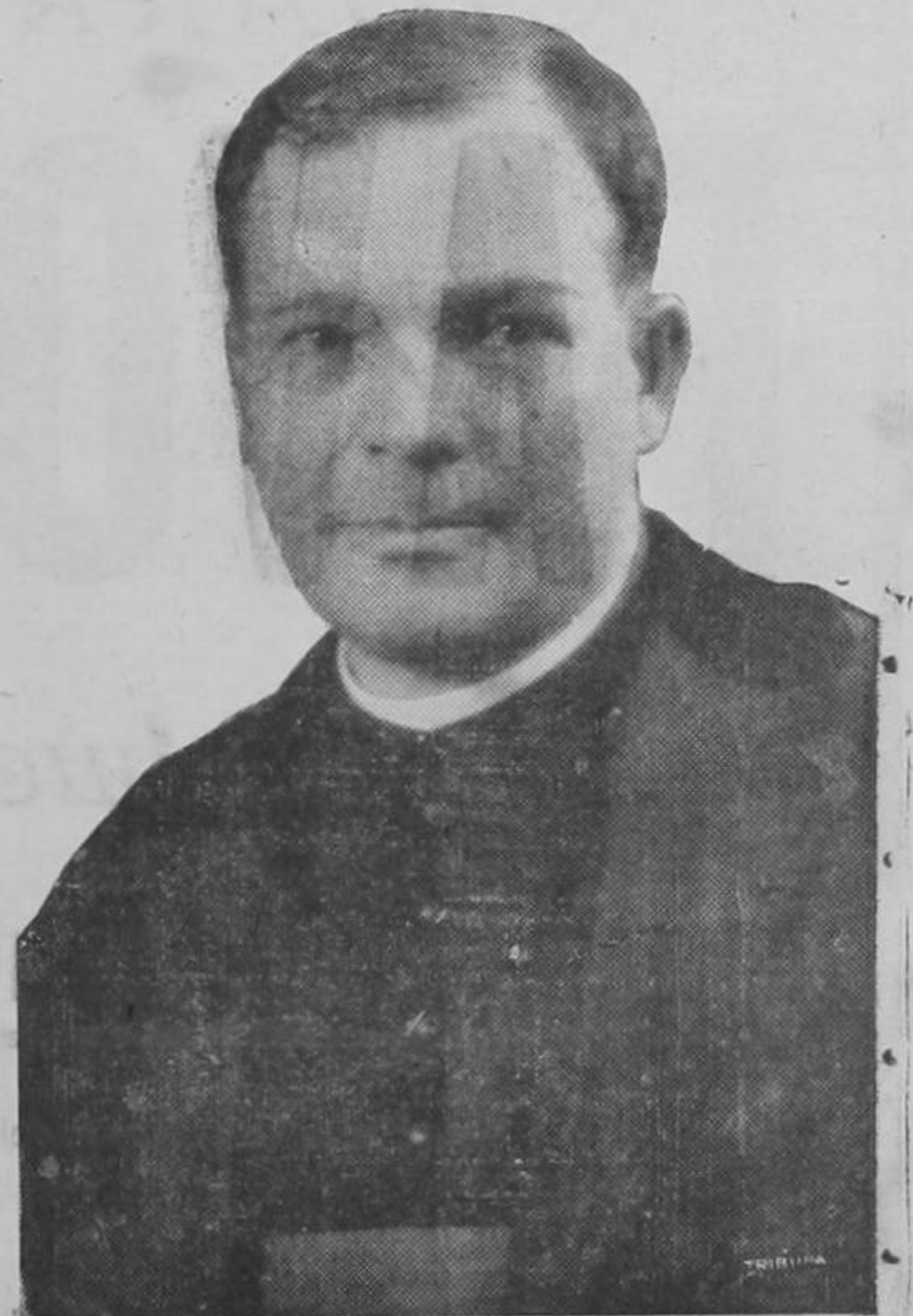
MONSEÑOR ALFREDO HIDALGO

Electo en la tarde de ayer por el Cabildo Metropolitano, Vicario Capitular, Sede Vacante, asumiendo inmediatamente el gobierno de la Arquidiócesis, hasta tanto Su Santidad el Papa Pío XII haga el nombramiento de nuevo Arzobispo.