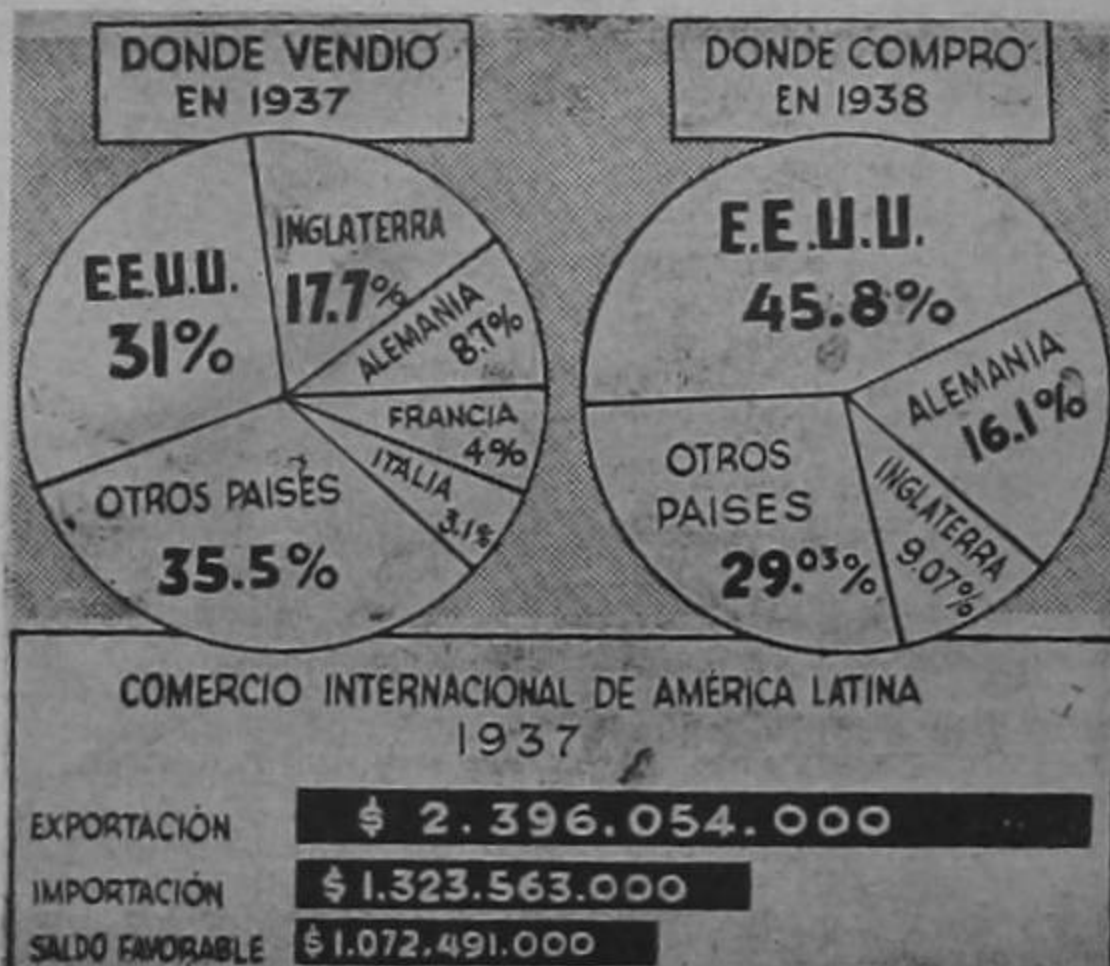
La gráfica da claramente una idea de lo que ha sido del comercio internacional de nuestro Continente durante los años 1937 y 1938.