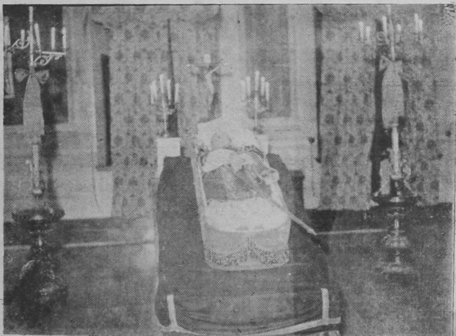
El Venerado Prelado fallecido ayer, en la capilla ardiente instalada en el Palacio Arzobispal, edificio contiguo a la Iglesia Metropolitana, por donde han desfilado ya desde anoche, miles de fieles de todas las clases sociales, para ver por última vez al amado pastor.

MONTEVIDEO, 15. UP— El cortejo funeral de los 30 marineros alemanes llegó al cementerio a las 9 y 35 minutos de la mañana de hoy, sin que se hubiese presentado el menor incidente a lo largo de la ruta por las afueras de esta capital. Mas de cinco mil personas se agolpaban por las afueras de esta capital. Mas de cinco mil personas se agolpaban por las afueras de esta capital. Mas de cinco mil personas se agolpaban por las afueras de esta capital. PASA A LA PAG. 4