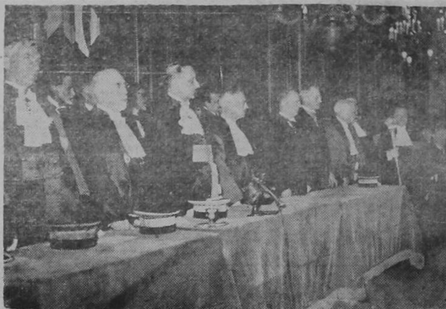
Fotografía tomada al iniciar sus cursos la Universidad de París recientemente, acto que fue presidido por el Presidente de Francia, Mr. Lebrun.